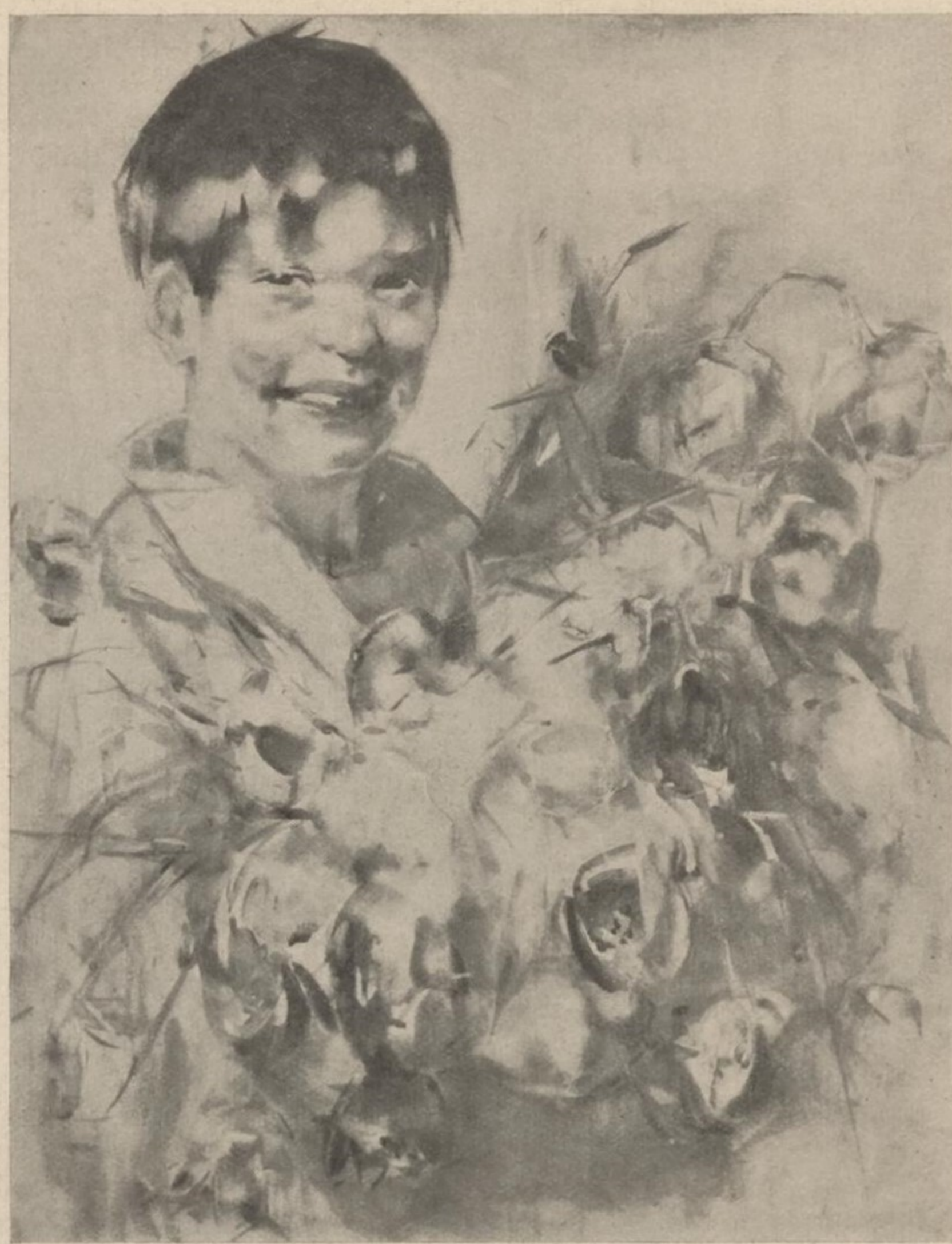
Jongen met tulpen.