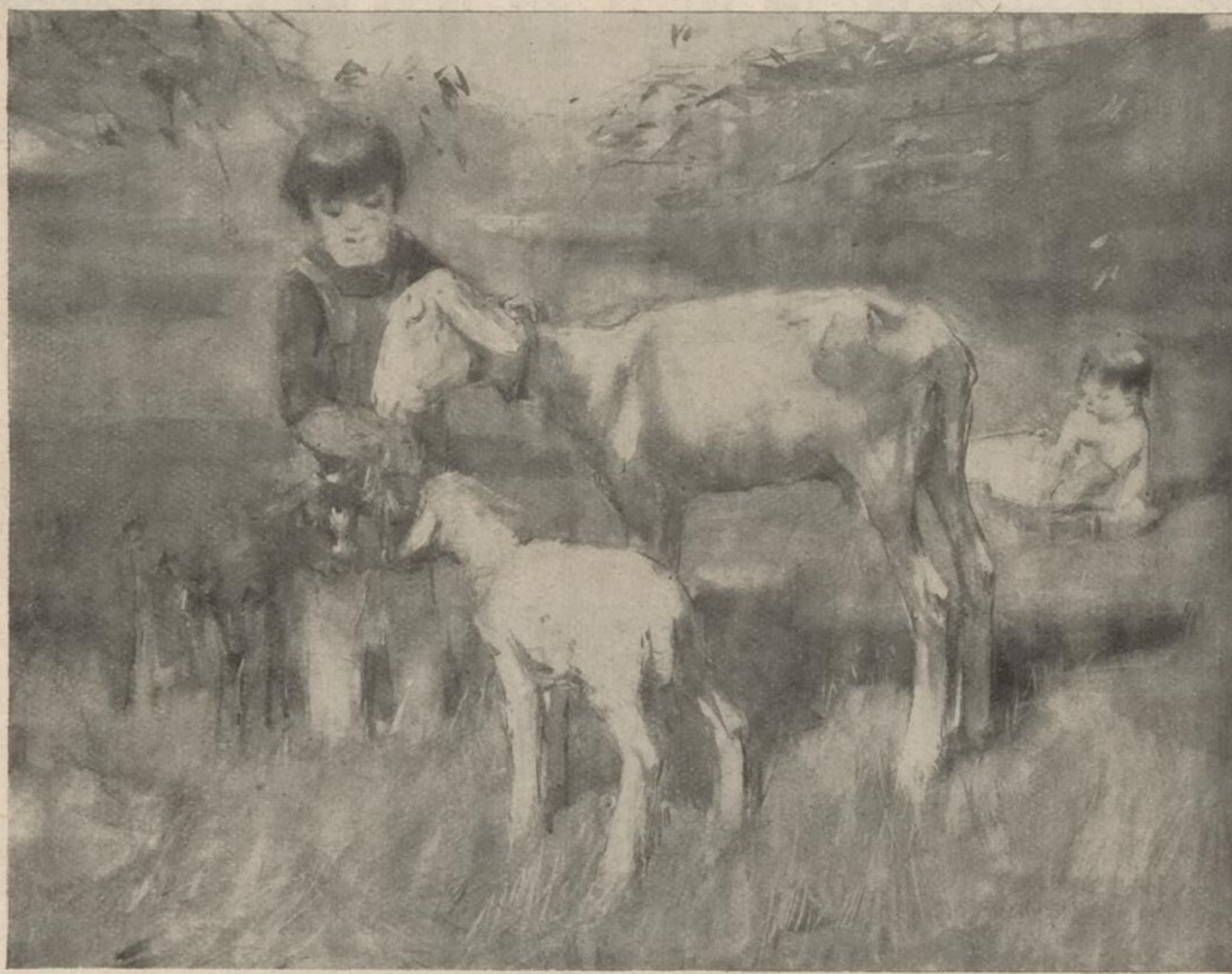
Kinderen en schapen.

Sommige van zijn kerkrumten deden zeer veel aan Bosboom denken, maar ik heb er ook gezien, waarin hij los van den grootmeester was, en zichzelf gaf, zonder meer. Zijn schildering, hoe achteloos, los en zwierig er somtijds uitziet, rust op degelijke basis; van jongs af teekende hij al, en daarna was het „alsmaar” teekenen, teekenen, en nog eens teekenen. De oude philoloog Daniel Wyttenbach zei eens: „O heilzaam voornemen van steeds herhalen, en nooit genoeg te prijzen”; mutatis mutandis, zouden we dit, op het teekenen toegepast, het devies van Van Meegeren kunnen noemen. Teekenen lijkt hem de hoofdzaak, het vrijwel ééne noedige voor het maken van een schilderij (we nemen er natuurlijk bij aan dat een schilder compositie-talent en kleurgevoel heeft, en deze zijn in niet geringe mate bij Van Meegeren aanwezig), en daarvoor moet men volgens hem — en ook volgens mij — de teekening volkomen beheerschen. Anders blijft het min