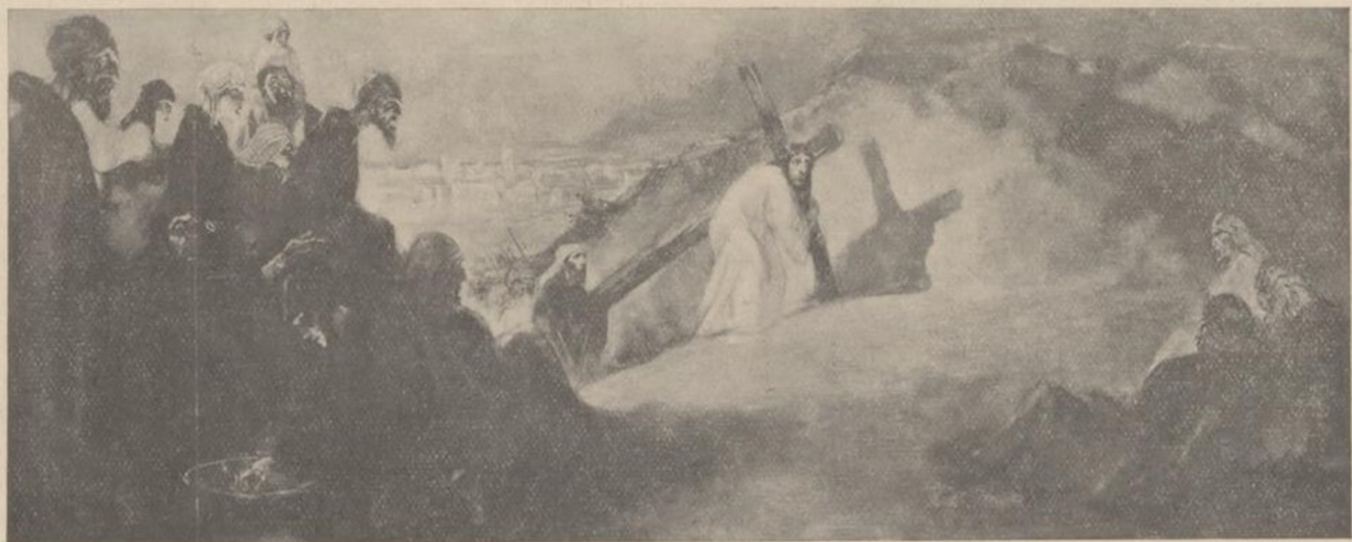
Jerusalem, dat Uw Profeten doodt!

Stil gaan de Hagenaars, die het voorrecht bezitten, lid te zijn van de instelling: Kunstzaal Kleykamp! — stil gaan de vreemdelingen, die mèer dan wij, Hollanders, wèten, dat er hier iets onvergelykelyk schoons bijeen is! — Zij dwalen door de zalen en dwalen door dien droom van eeuwen! Vreemde bloemen bloeien daar voor hun oogen; — vreemde dieren leven daar hun gedrochtelijk leven; — priesteracht en keizer-majesteit glijdt in pracht aan hunne ver-