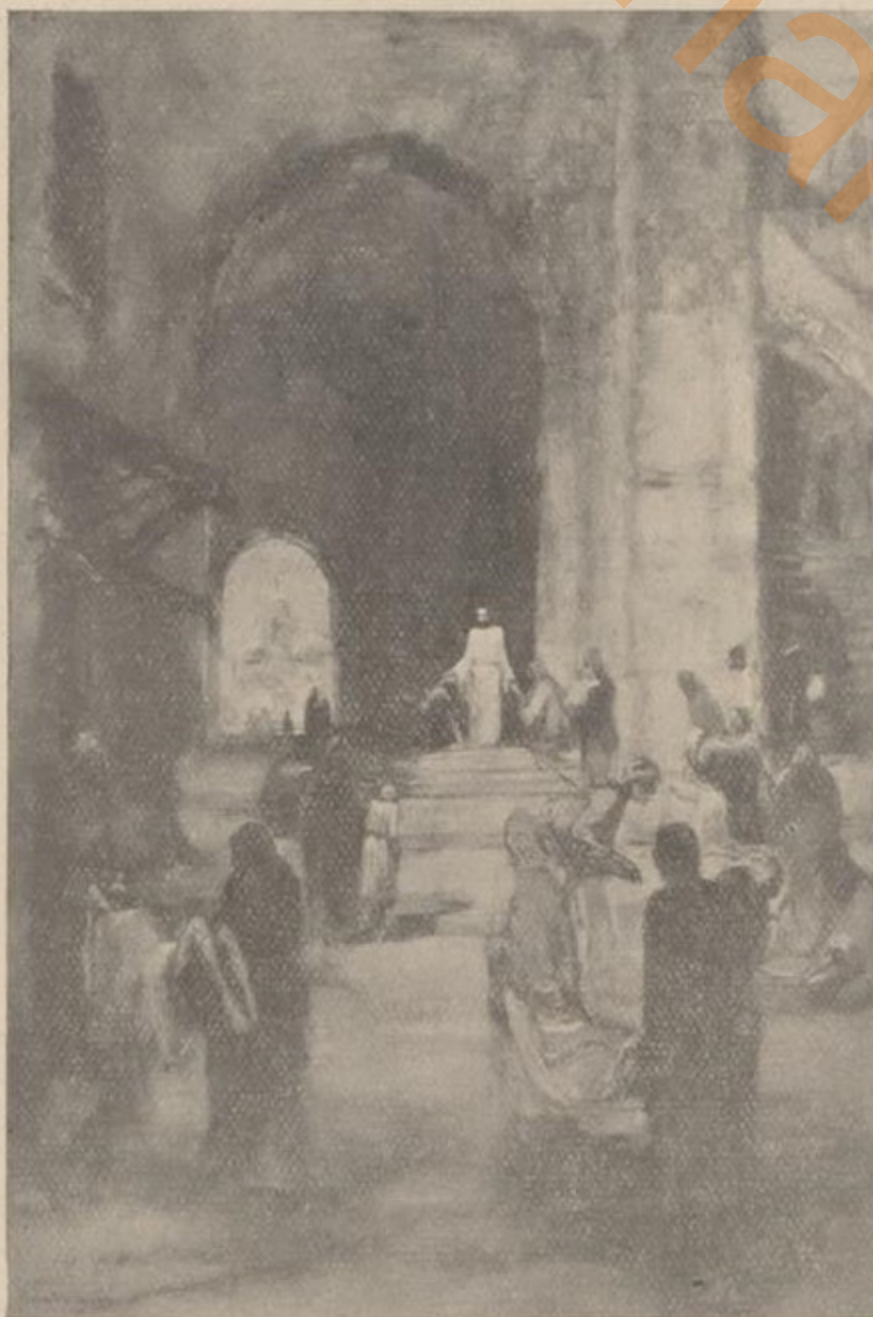
En er kwamen blinden en kreupelen tot hem in den Tempel en Hij genas dezelve. Mattheus XXI: 14.