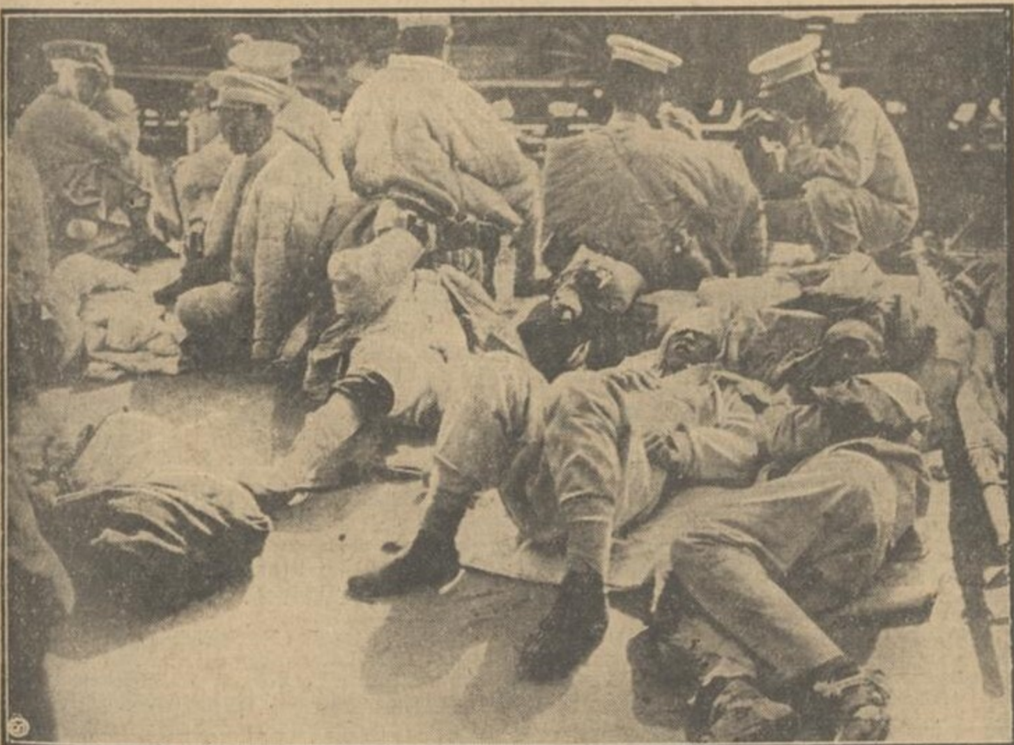
DE CRISIS IN CHINA. — De in de gevechten tusschen Nationalisten en de Noordelijke troepen gewonde Cantonnezen worden te Hankau binnengedragen.