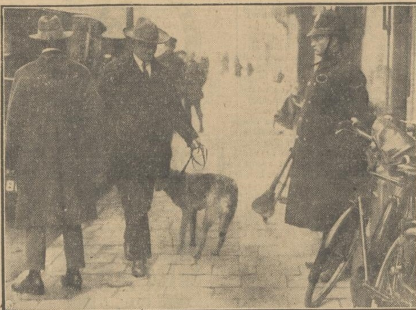
ONMIDDELIJK NA HET ONTDEKKEN VAN DEN MOORD AAN HET BEZUIDENHOUT — werden politiehonden aan het werk gezet, helaas zonder resultaat.