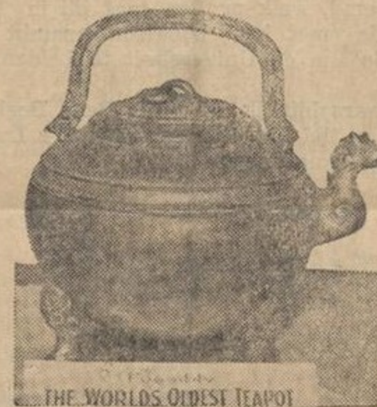
THE WORLD'S OLDEST TEAPOT

EEN THEEHANDELAAR te Londen heeft een Chineschen theepot in zijn étalage ten toon gesteld, die, voor zoover men kan nagaan, de oudste ter wereld is.