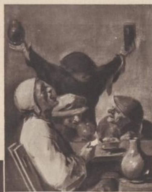
Adriaen Brouwer (1605-1638) „Uitgelaten boeren”