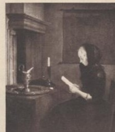
Gerard Terborch (1617-1681) „De brief”