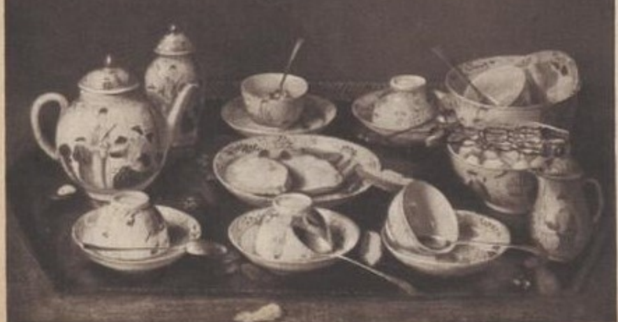
„Het servies door Etienne Liotard” (Genève, 1702-1789)