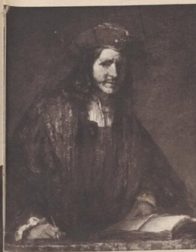
Rembrandt (1606-1669) De man met de rode muts