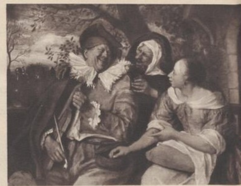
Jan Steen (1626-1679) „De bedrogene”