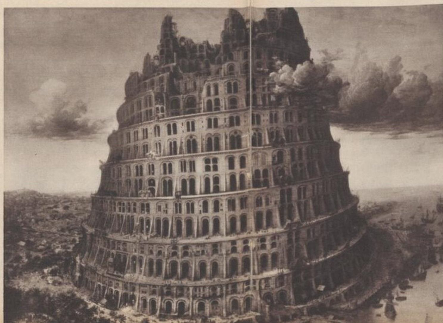
Pieter Bruegel de Oude (1525-1569) „De Toren van Babel”

M eesterwerken uit vier eeuwen is de tentoonstelling betiteld, die gedurende de zomermaanden in het Museum Boymans te Rotterdam wordt gehouden. Of — zou men deze kolossale expositie, die niet minder dan 21 zalen beslaat, anders moeten noemen en zou men moeten spreken van „Verzamelingen uit de laatste veertig jaar”? Want alles wat hier te zien is, is ontleend aan wat Nederlandse verzamelaars gedurende de regeringsperiode van Koningin Wilhelmina hebben verworven. Het is slechts een keuze, die hier getoond wordt; deze 200 schilderijen en 250 tekeningen vertegenwoordigen „slechts” een deel van wat zich aan kunstbezit in Nederland bevindt.