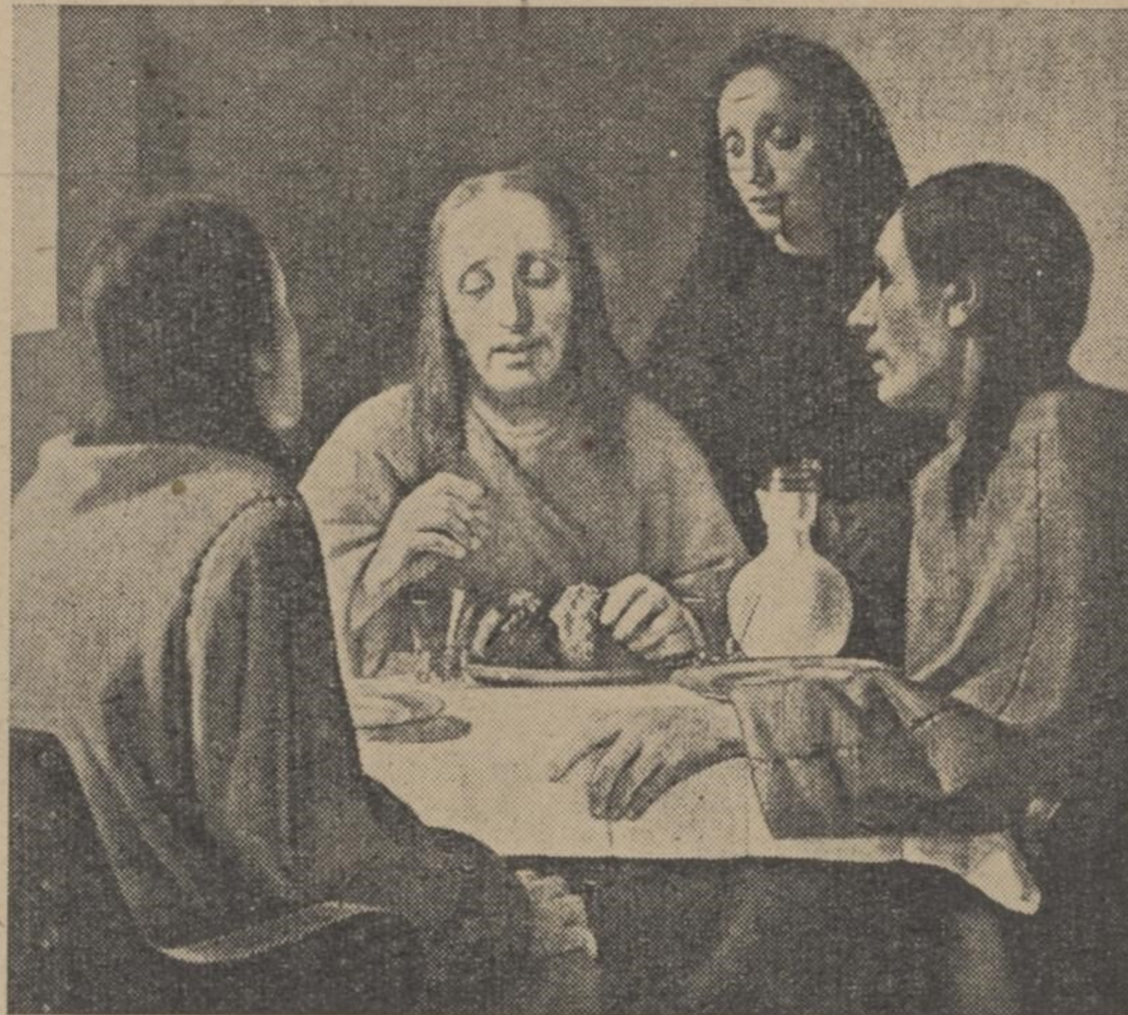
Het veel omstreden schilderij

Nog meer echter dan met mezelf heb ik meelij met die „Emmausgangers”. Want nu worden ze zelfs geopereerd ook, ze worden chemies onderzocht en geröntgend. Ziet u wel, er zit meer achter. En als nu blijkt, dat de longen niet goed zijn, dan wordt het meteen met de vuilnisman meegegeven, want wat u nog niet wist, maar ik wel, is, dat Vermeer een prima longenschilder was en dat dat nu juist het zwakke punt is van Han van Meegeren — ze hebben